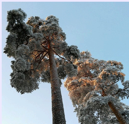
Kuva ja teksti Tiina Peippo